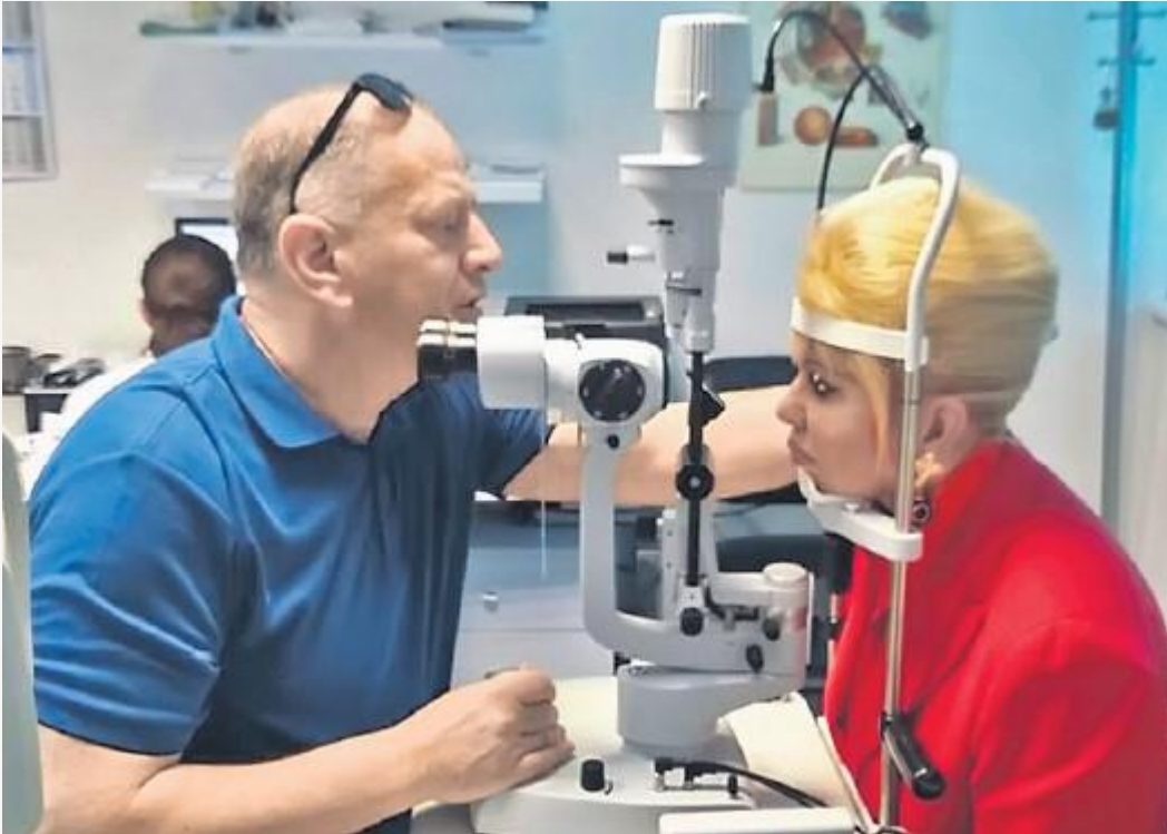
Иванка Трамп проверила вид у клиници "Свјетлост"